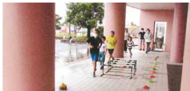
陸上教室活動風景