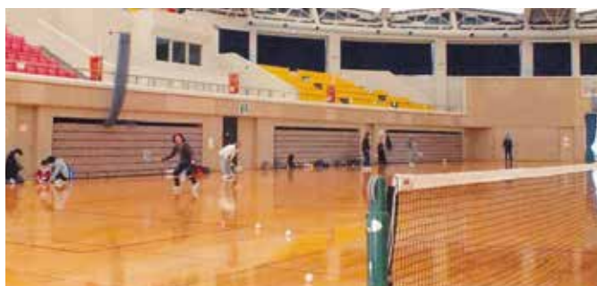
ソフトテニス活動風景