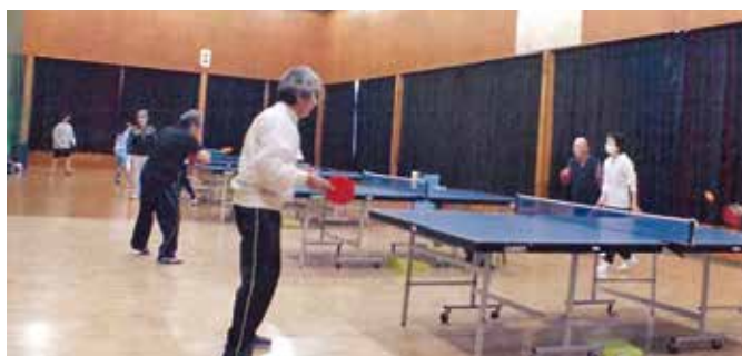
ラージボール卓球活動風景