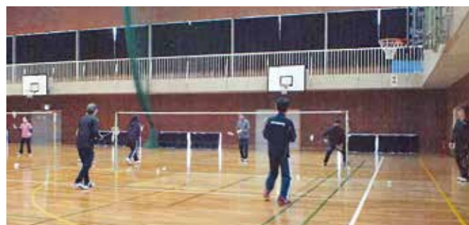
バドミントン活動風景