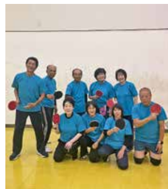
卓球教室 集合写真