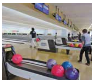
健康ボウリング教室